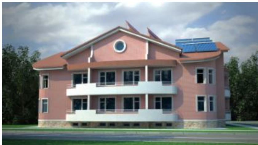
Рисунок 3 - Проект здания «12-ти квартирный энергоэффективный жилой дом» компании «ЭкоДолье».

В понятие энергоэффективного жилого дома закладывается комплекс конструктивных решений и дополнительных инженерных систем, в результате которых достигается реальное снижение затрат на эксплуатацию.