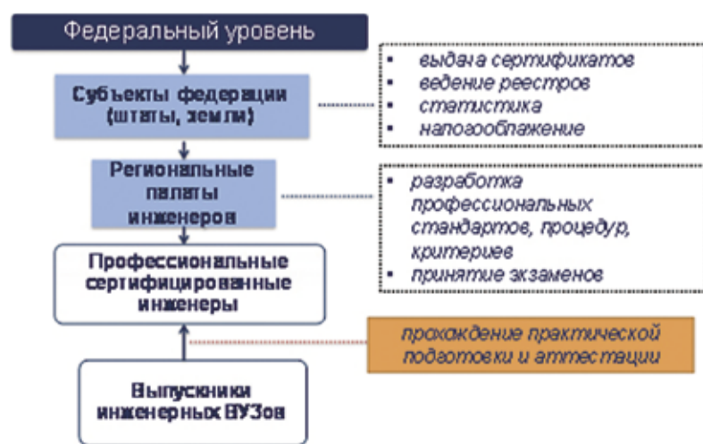
Слайд 4. Система регулирования инжиниринга в странах ВТО