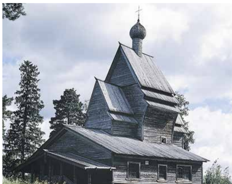
Рисунок 2. Посиврье. Дер. Юковичи (Родионово). Георгиевская церковь. 1493 г.