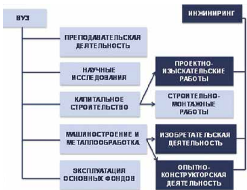
Слайд 3. Путь выпускников инженерных специальностей

Пресс-служба Единой Строительной Тендерной Площадки СРО