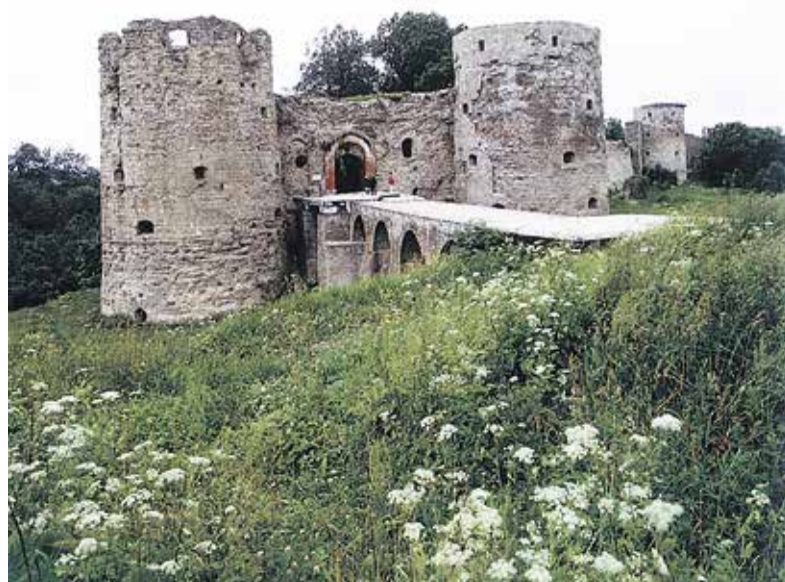
Рисунок 3. Копорская крепость, заложена в 1237 г. Объект Всемирного наследия ЮНЕСКО